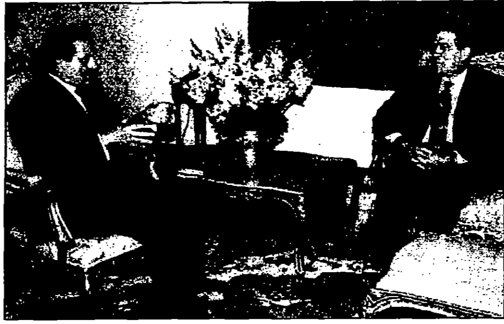
الرئيس مبارك خلال استقباله لنائب رئيس الوزراء كمال الجنزوري حيث كلفه بتشكيل الحكومة المصرية الجديدة.